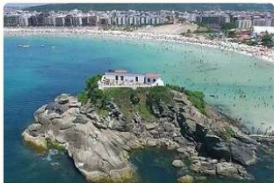
PRAIA DO FORTE

Cabo Frio conta com diversas opções de passeio, mas o que mais chama atenção na cidade são suas praias de areia branquinha e o mar com um tom de azul de tirar o fôlego. Abaixo, falaremos sobre algumas opções de praias pra você conhecer e se apaixonar!