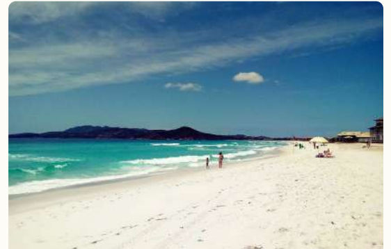
PRAIA DO FOGUETE

A praia fica a 4 km do centro de Cabo Frio, e pode ser acessada pela Rua das Dunas ou pela Rodovia General Bruno Martins, a praia fica do lado esquerdo, sentido Arraial do Cabo