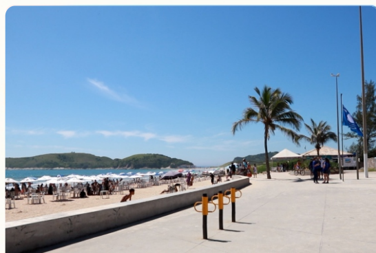
PRAIA DO PERÓ

A Praia do Peró é um show à parte. Suas águas tem um tom de azul que encanta, seu mar é mais agitado, então, cuidado redobrado com as crianças! Conta com 7km de extensão, sua orla possui vários quiosques que oferecem comidas e bebidas variadas. Em 2018, recebeu a premiação internacional BANDEIRA AZUL , que garante a qualidade da areia, da água e acessibilidade, sendo a primeira praia do estado do Rio de Janeiro a garantir o prêmio.