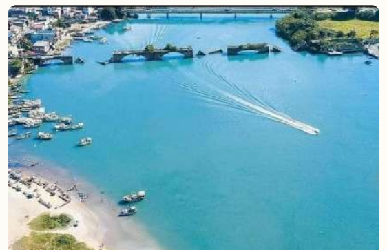
PRAIA DO PONTAL DE SANTO ANTÔNIO

O acesso é pela Av. Beira Mar, sentido Barra de São João