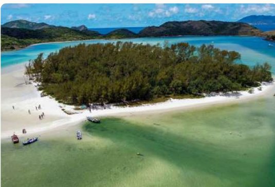
ILHA DO JAPONÊS

A Ilha do Japonês é o tipo de lugar obrigatório pra conhecer quando vier à Cabo Frio. Com águas calmas, transparentes e azuis, a Ilha é formada no final da Lagoa de Araruama , onde há o encontro da lagoa com o mar. O local é ideal para a prática de caiaque, canoagem, remo, windsurfe, stand up paddle e ecoturismo.