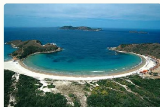
PRAIA DAS CONCHAS

Essa pequena enseada é vizinha da Praia do Peró e fica entre o Morro do Vigia e pela Ponta do Arpoador. Possui um visual incrível e diferenciado com o seu formato de concha, com águas calmas e cristalinas , perfeita para prática de mergulho.